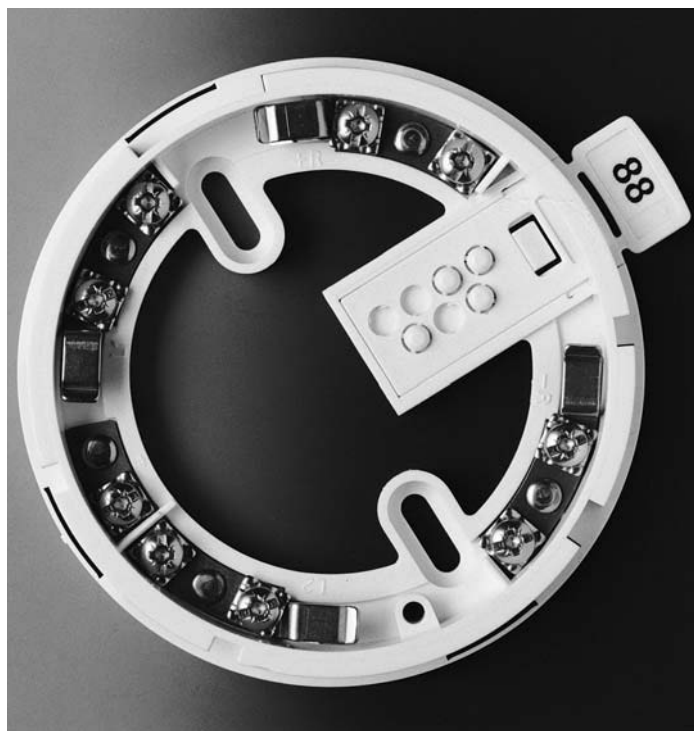
XP95/Discovery Монтажная база с XPERT картой ▲ Код 45681-210